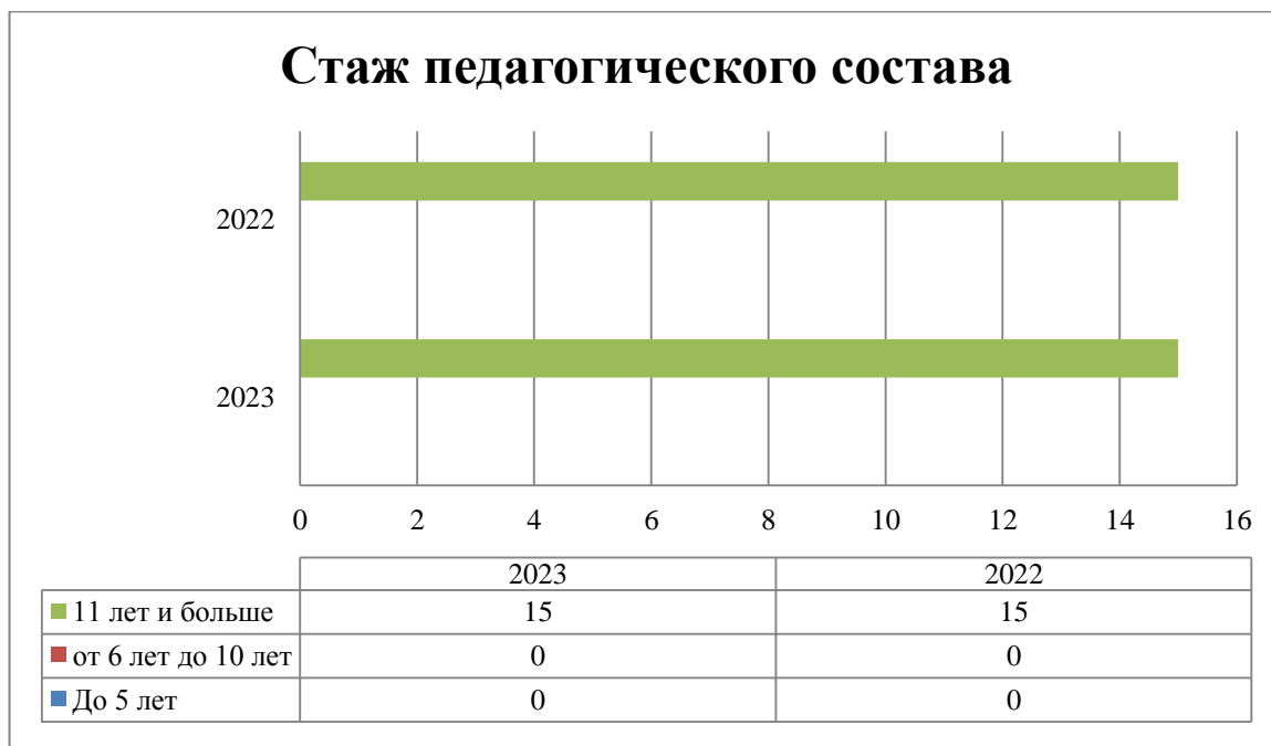
Гистограмма с характеристиками кадрового состава МБДОУ «ЯСЛИ-САД № 12 «РОМАШКА»

Согласно плану методической работы в рамках повышения компетенции педагогов по вопросам реализации ФОП ДО были организованы и проведены следующие мероприятия: